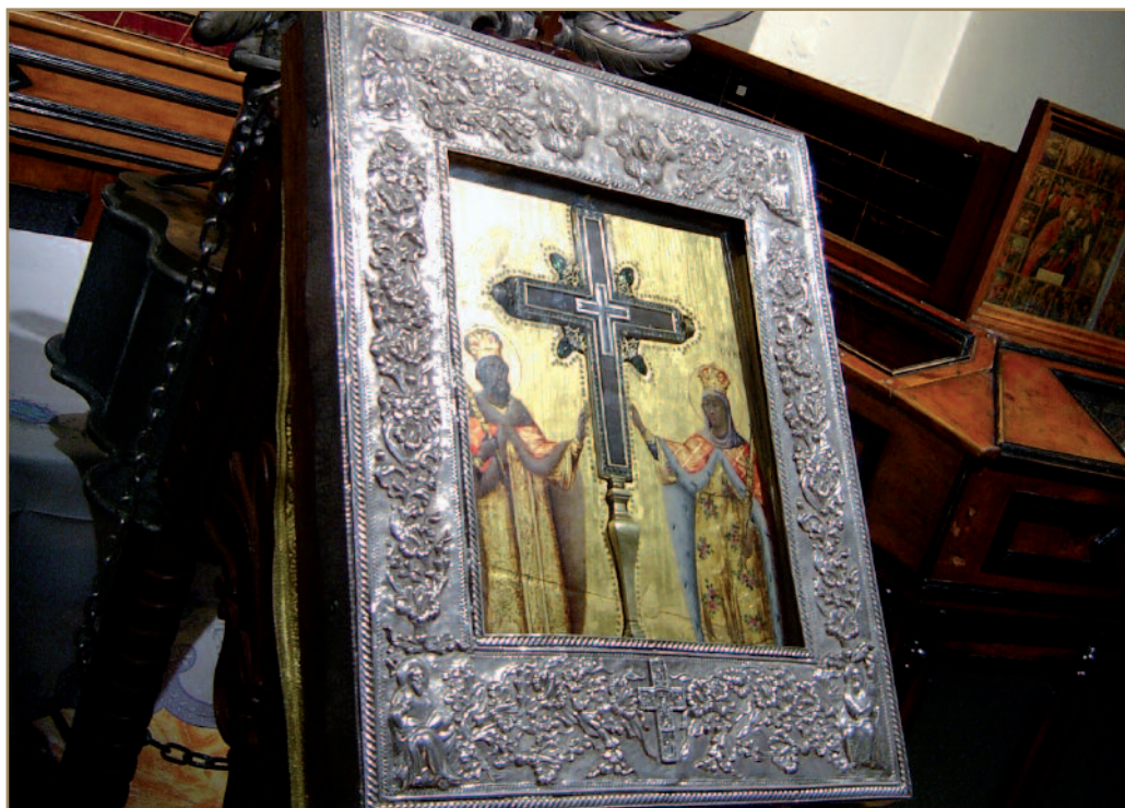
Gerusalemme, Santo sepolcro, reliquia della vera Croce

foglietti preconfezionati è da utilizzare solo in casi estremi: la consuetudine da instaurare o da affinare dovrebbe essere quella di un gruppo di fedeli che si dedica a riflettere sui testi biblici e poi prepara le integrazioni di preghiere da proporre durante la celebrazione. In questo modo si può parlare veramente di preghiera “dei fedeli”, che appartiene alla comunità, perché alcuni membri leggono i bisogni reali del popolo di Dio e si fanno interpreti di una formulazione che sia pensata per un’assemblea concreta. Questo significa mettere in pratica i principi di partecipazione dei fedeli alla Celebrazione, raccomandati in Sacrosanctum Concilium , 14.